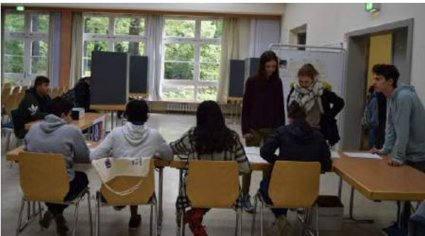
Unsere WahlhelferInnen in Aktion