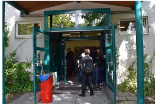
Schlange stehen bei der Wahl